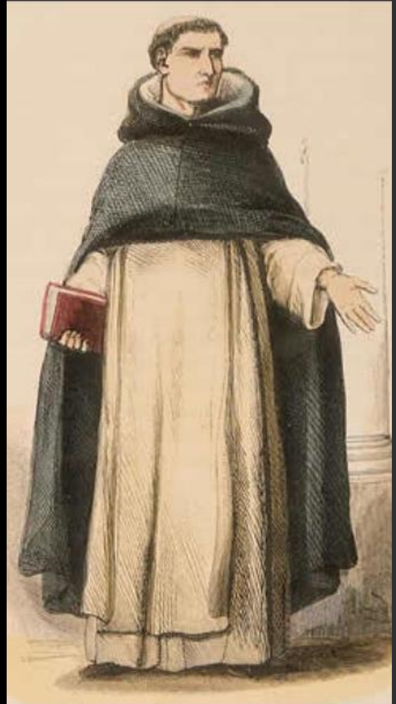
Domonkos rendi szerzetes